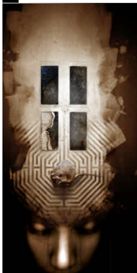
Algernon (2001) infographie